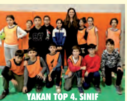
YAKAN TOP 4. SINIF