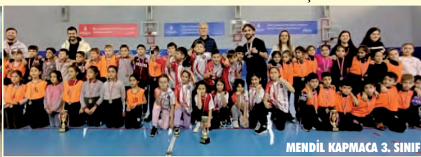
MENDİL KAPMACA 3. SINIF