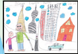
Furkan Hamza ÇELEBİOĞLU 4/D