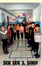
SEK SEK 3. SINIF