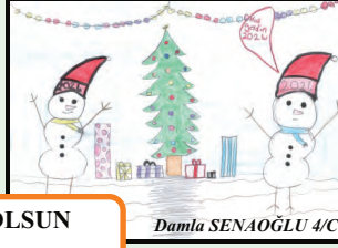
Damla SENAĞLU 4/C