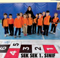
SEK SEK 1. SINIF