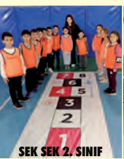
SEK SEK 2. SINIF

Okulumuz Bağcılar İlçe Milli Eğitim Müdürlüğünün organize etmiş olduğu mendil kapmaca, sek-sek ve yakan top turnuvalarında tüm kategorilerde katılım sağlamıştır. Öğrencilerimiz turnuvalarda kazanmak için centilimce mücadele ettiler. Mendil Kapmaca Turnuvasında 3. sınıf düzeyinde katılım sağladığımız takımımız İLÇE ÜÇÜNCÜSÜ olarak okulumuzu onurlandırmıştır.