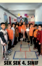
SEK SEK 4. SINIF