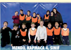
MENDİL KAPMACA 4. SINIF