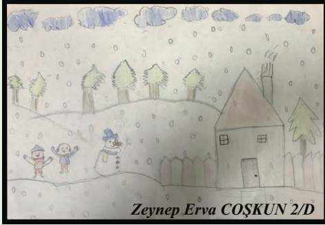
Zeynep Erva COŞKUN 2/D