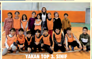
YAKAN TOP 3. SINIF